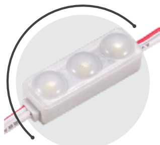
MINI 3 0,4 W