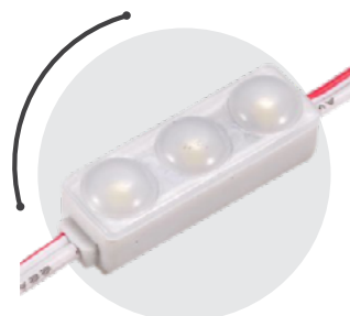
MINI 3 0,7 W