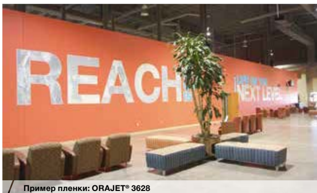
Пример пленки: ORAJET® 3268