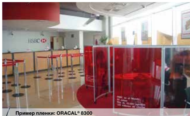
Пример пленки: ORACAL® 8300