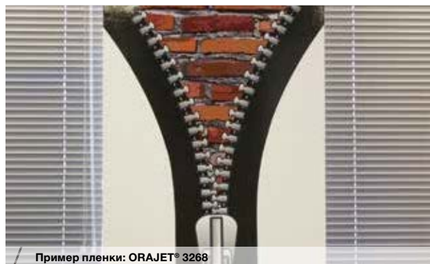
Пример пленки: ORAJET® 3268