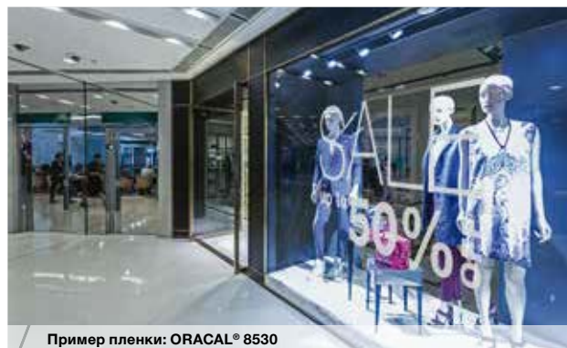
Пример пленки: ORACAL® 8530