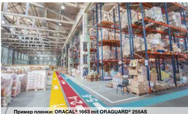
Пример пленки: ORACAL® 1663 mit ORAGUARD® 255AS