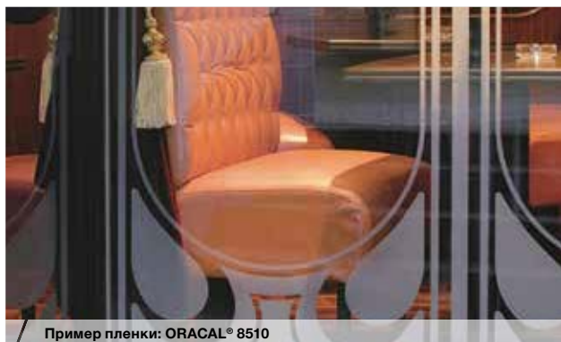
Пример пленки: ORACAL® 8510