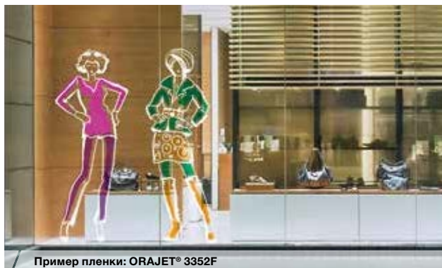
Пример пленки: ORAJET® 3352F