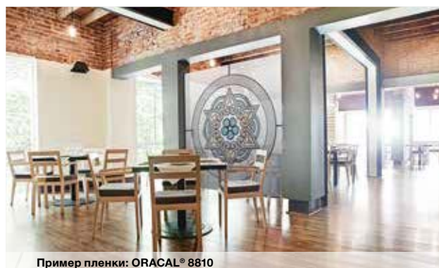
Пример пленки: ORACAL® 8810