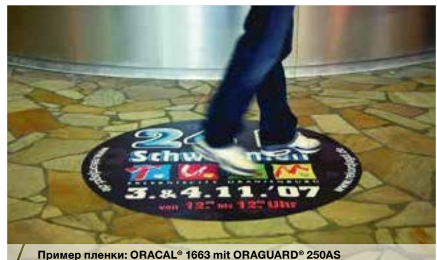
Пример пленки: ORACAL® 1663 mit ORAGUARD® 250AS