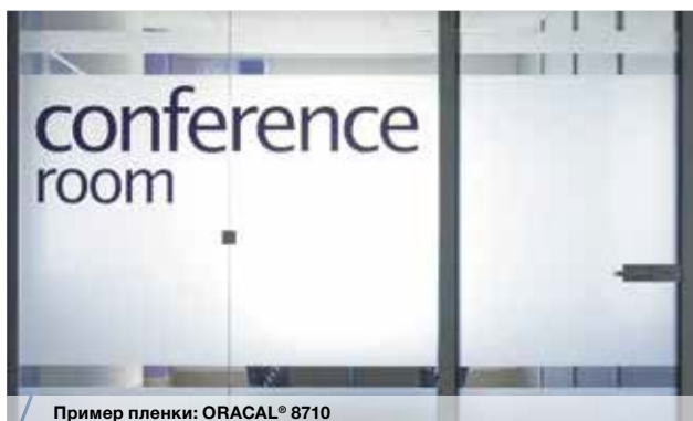
Пример пленки: ORACAL® 8710