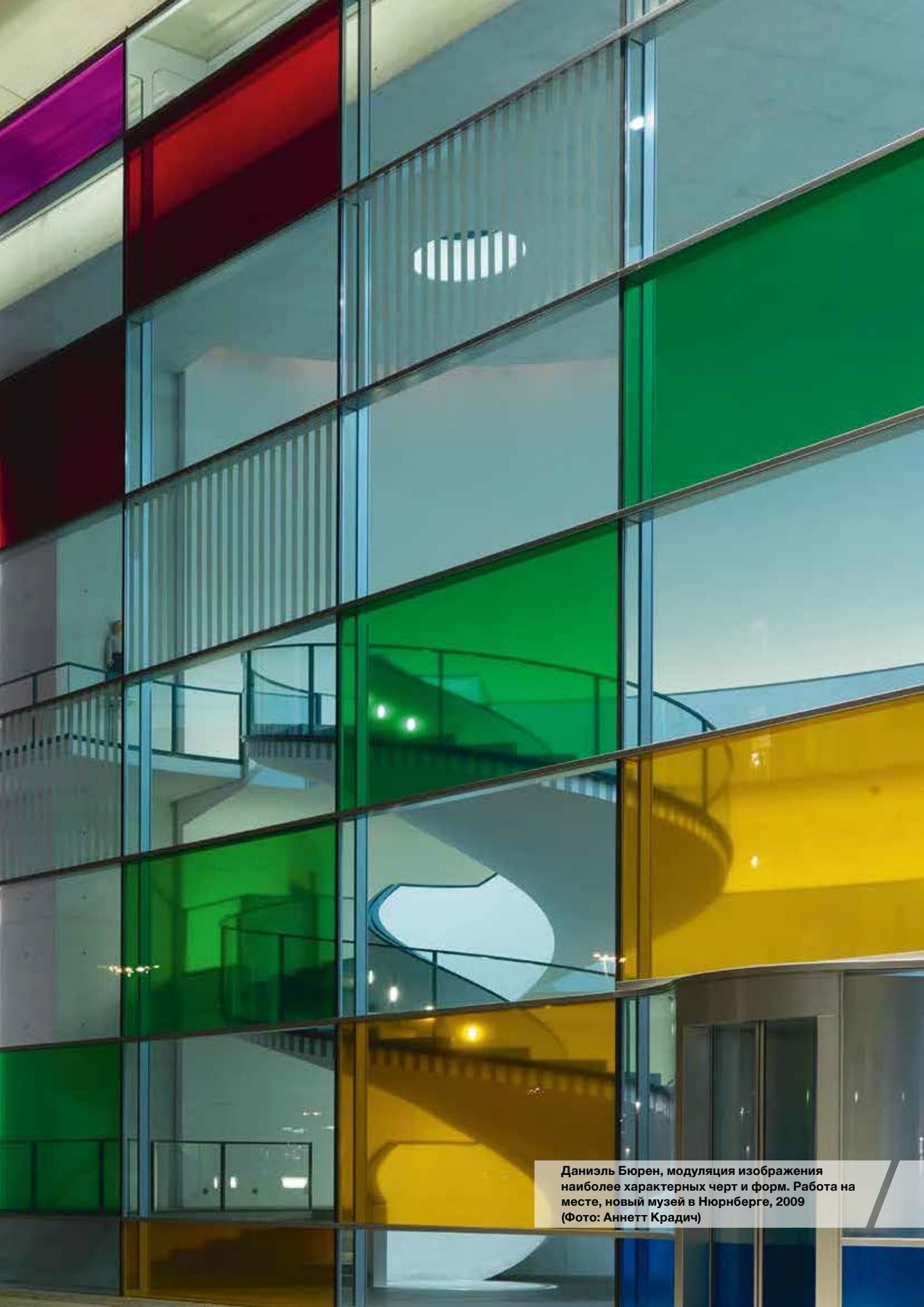
Даниэль Бюрен, модуляция изображения наиболее характерных черт и форм. Работа на месте, новый музей в Нюрнберге, 2009